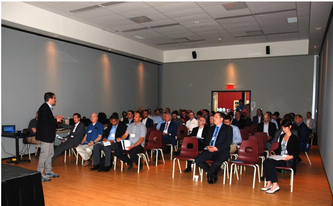
Les acteurs majeurs du secteur de l'énergie confirment l'attractivité de la ville